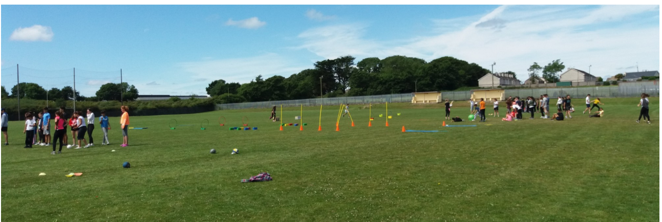
Campos de Hurling y Rugby