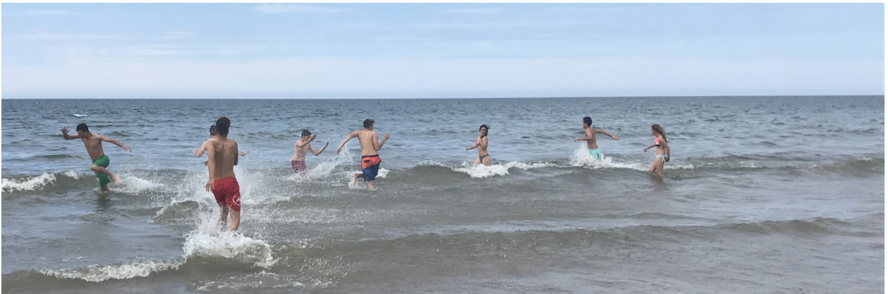
Pueblo costero con playa