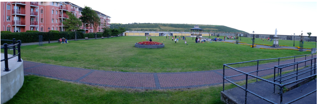
Jardines y parques