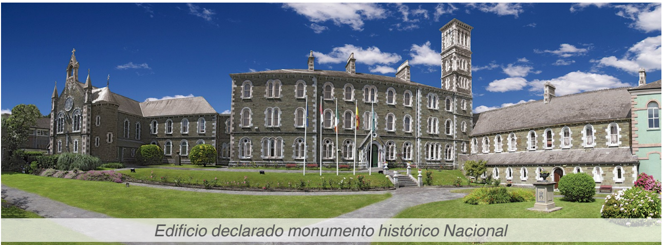
Edificio declarado monumento histórico Nacional

Único Summer Camp en Youghal para el aprendizaje de inglés