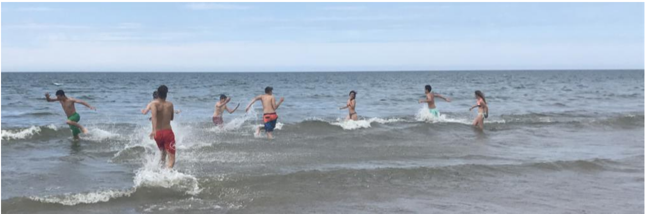
Pueblo costero con playa