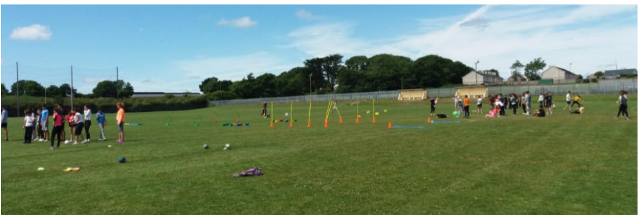
Campos de Hurley y Rugby