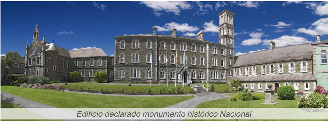
Edificio declarado monumento histórico Nacional

Único colegio-residencia para programas de verano en Youghal