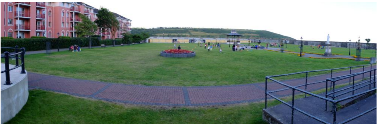
Jardines y parques